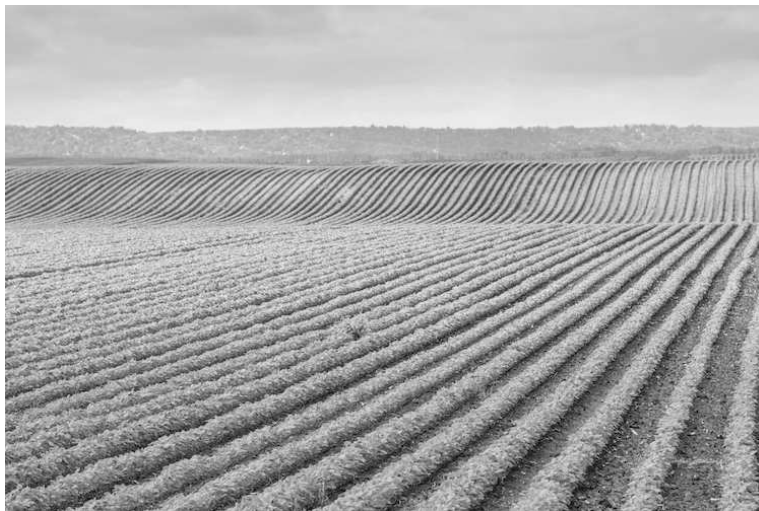
Sequestrati falsi concimi contenenti matrina

L'operazione è stata condotta tra Sardegna e Puglia dalla Guardia di finanza del Nucleo di polizia tributaria di Cagliari e dell'Ispettorato repressione frodi