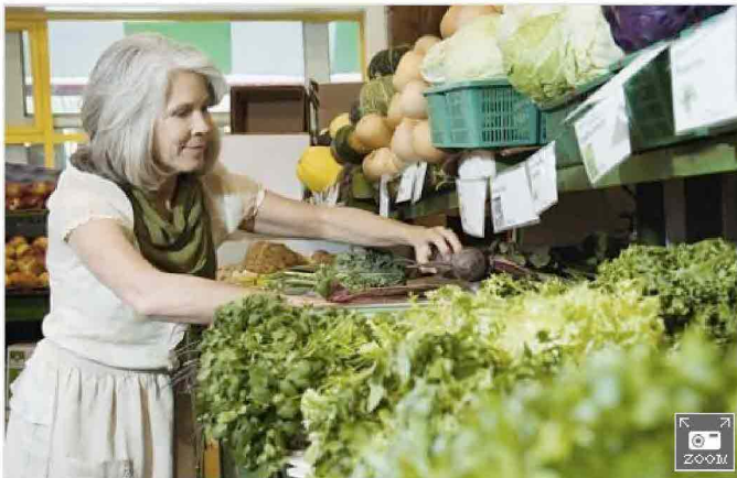
FederBio: Rilanciare il Piano d'Azione nazionale per il biologico

Tutte le notizie su: Biologico Federbio Italia